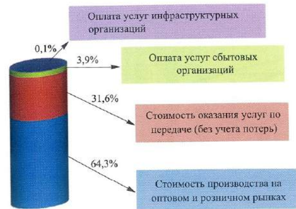
Рис. 3. Структура розничной цены на электрическую энергию в целом по Российской Федерации в 2013г.

В части объёмов продажи электрической энергии и мощности по регулируемым ценам тарифы для поставщиков с 2008 г. определяются с применением метода индексации в соответствии с формулами индексации регулируемых тарифов на электрическую энергию (мощность).